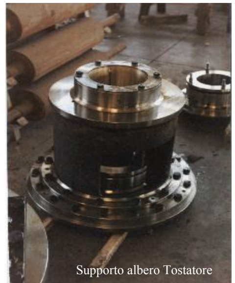
Supporto albero Tostatore