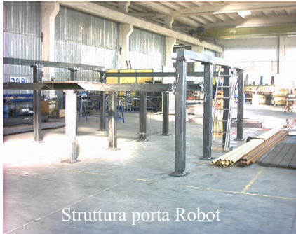
Struttura porta Robot