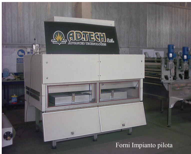
Forni Impianto pilota